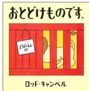
『おとどけものです。』 ロッド・キャンベル／作 あすなる書房

どうぶつえんに「べつとを おくってください」と てがみをかきました。 どうぶつえんからとどいたのは…。