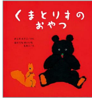
『くまとりすのおやつ』 きしだ えりこ／ぶん ほりうち せいいち／え ほりうち もみこ／え 福音館書店

みて みて どうぶつの いいおかお。 いろんな おかおが あって おもしろいよ。