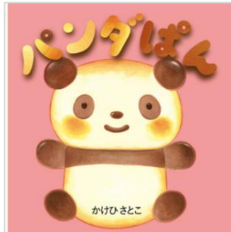
『パンダぱん』 かけひ さとこ／さく・え 教育画劇

どうぶつえんに「べつとを おくってください」と てがみをかきました。 どうぶつえんからとどいたのは…。