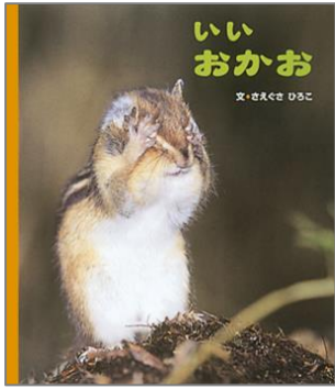
『いいおかお』 さえぐさ ひろこ／文 アリス館

みて みて どうぶつの いいおかお。 いろんな おかおが あって おもしろいよ。