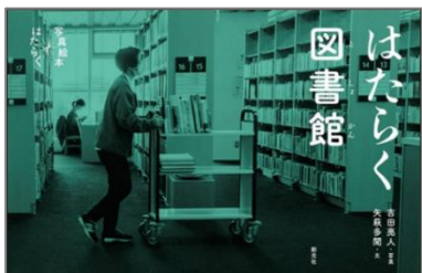
『はたらく図書館』 よしだ あきひと しゃしん 吉田 亮人／写真

図書館にはどんな仕事があるのでしょうか？ たなの本を整えたり、返された本を一冊ずつチェックしたり…。