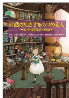
『お話のたきぎをあつめる人 魔法の図書館の物語』 ローレンティン妃／作 パウル・ヴァン・ローン／作 にしむら ゆみ しゃしん 西村 由美／訳 佐竹 美保／絵 徳間書店

ステレは本を読むのが大好きでした。でも、一冊しか本を持っていないので、くりかえし何度も読むうちにこわれてバラバラになってしまいました。