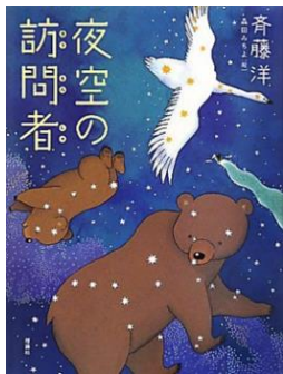
『夜空の訪問者』 さいとう ひろし さく 齊藤 洋 / 作

ある日、ぼくは公園でしゃべるオオハクチョウに出会った。オオハクチョウは星座のハクチョウ座にめぐりあうために旅をしているという。ぼくは、オオハクチョウから、実際に星座とめぐりあったという動物たちの話を聞くことになったんだ。