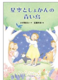
『星空としゃかんの青い鳥』 ほしぞら あおとり こでまり こんどう 小手鞠 るい / 作 近藤 未奈 / 絵 小峰書店

飛行機が空港にと到着してから、次に出発するまでの短い時間。その間に、荷物を出し入れしたり、安全を確認したり、とにかく大いそがし！この仕事のおかげで、飛行機はまた空へ飛び立つことができます。