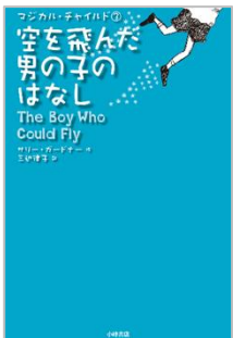
『空を飛んだ男の子のはなし』 そら と おとこ サリー・ガードナー / 作 さんべ りつこ やく 三辺 律子 / 訳 小峰書店

星空としゃかんの軒下で、小鳥が巣をつくっていることを知ったつぐみ。学校から出された、一年間なにかを続けるといふプロジェクトのテーマを探していたつぐみは、その小鳥「つばめ」の観察日記をつけることにしました。