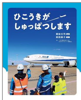
『ひこうきがしゅっぱつします』 おかだ みつし 岡田 光司 / 写真 おかだ やすこ ぶん 岡田 康子 / 文 文研出版

空港は空のげんかん口。そこで働くグラウンドハンドリングという仕事を知っていますか？