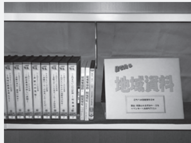
見る・聴く地域資料

中央図書館の地域資料コーナーに、稲城に関する視聴覚資料のコーナーを設けました。現在以下の資料の貸出ができます。映像や音で稲城のことを知りたいという方は、ぜひご利用ください。